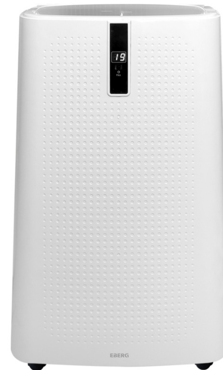
EBERG ENVA E35J2 - klimatyzator przenośny