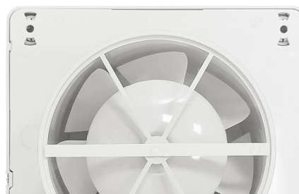
Wentylator wyposażony w kłapę zwrotną.