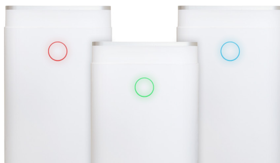
3-kolorowy podświetlany wskaźnik poziomu wilgotności powietrza.